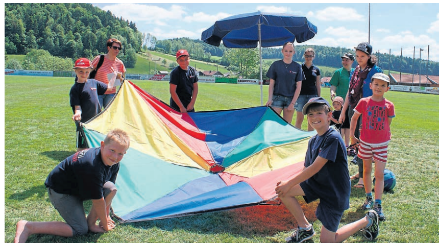
Auch heuer wieder Anziehungspunkt: das Schwungtuch.